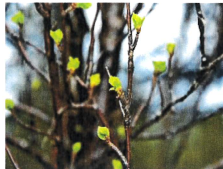
Museører på et tre.

Rett før bladene kommer ordentlig frem om våren, kan vi se små, grønne «museører» på trærne.